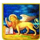
REGIONE DEL VENETO